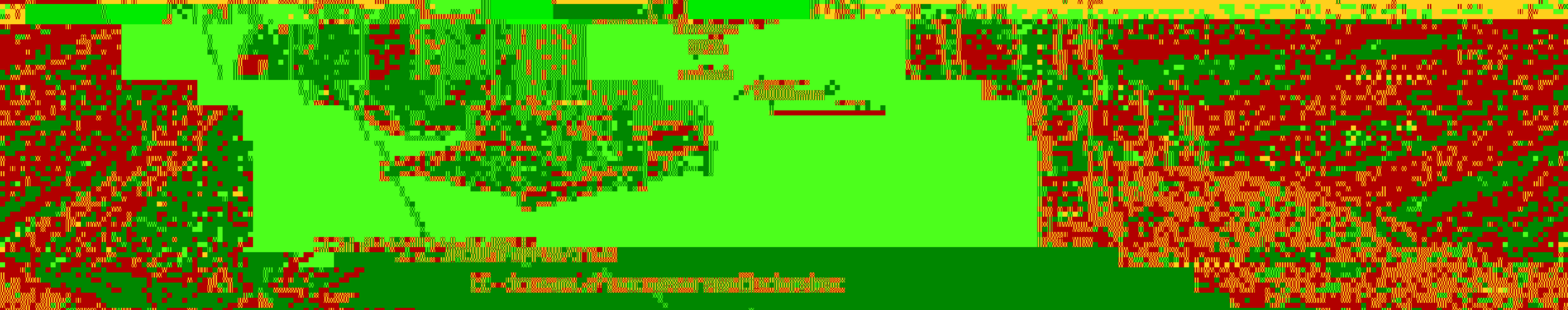
汉钟无油涡旋空气压缩机